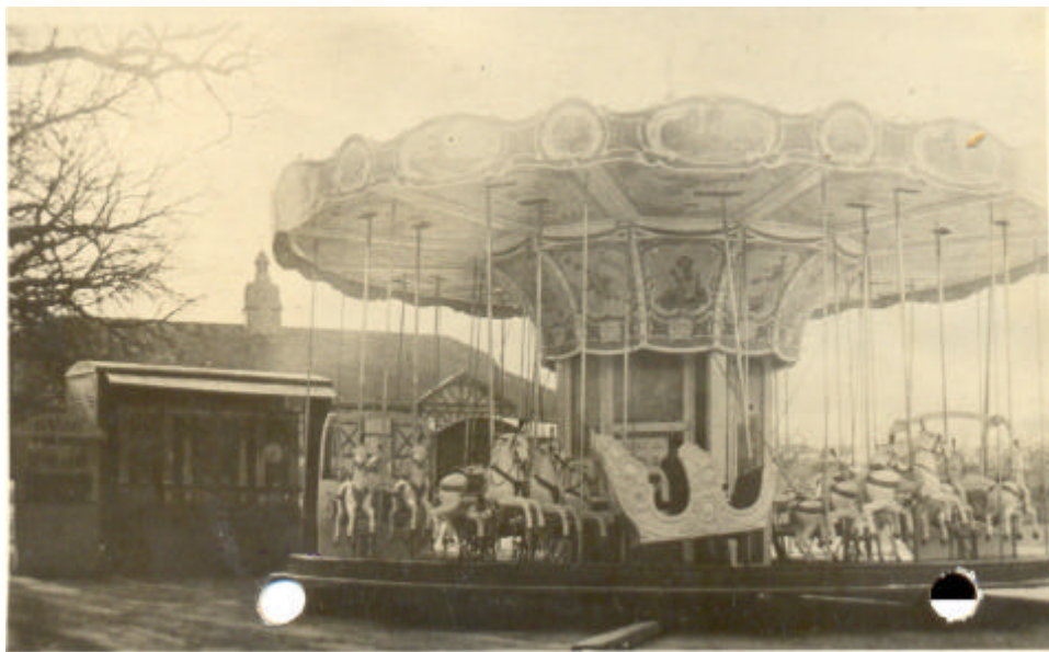
Abbildung 1: Kettenflieger-Karussell auf einem Oestricher Markt in den 1920er Jahren.

So weit meine persönliche Vorgeschichte, die aber dazu gehört, wenn ich etwas über die Märkte und Lustbarkeiten in Oestrich schreiben soll.