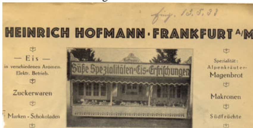
Abbildung 2: Briefkopf des Schaustellers Heinrich Hofmann aus dem Jahr 1933.

Je nach wirtschaftlicher Gesamtlage schwankte die Zahl der Bewerber um einen Standplatz zwischen 12 und 25. Anfangs bewarb man sich mit einer einfachen Postkarte, dann mit Klapp- und Doppelkarten. Im Laufe der Zeit gingen die Schreiben immer öfter auf Geschäftsbriefbögen mit einer Abbildung oder sogar einem Foto ein. Eine Bewerbung erreichte die Gemeindeverwaltung sogar auf einer Blanko-Trauerkarte. Die Antwort der Stadtverwaltung erfolgte aus Kostengründen gleich auf der Rückseite der Anfragen.